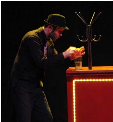
Muldoon La Punaise Scarabée (pas une punaise !), détective privé