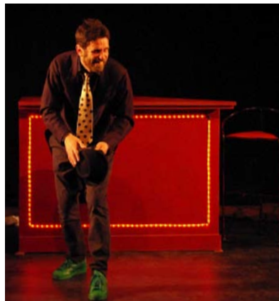
Général Krag Fourmi, chef des services secrets