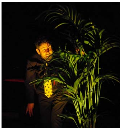
La Reine des guêpes Guêpe en chef, à côté de la plaque